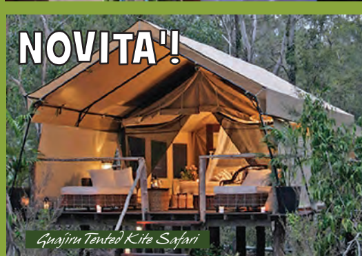
Guajirú Tented Kite Safari