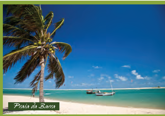
Pratia da Barra