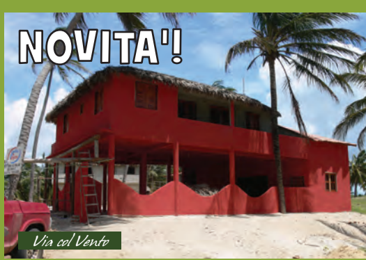
Via col Vento